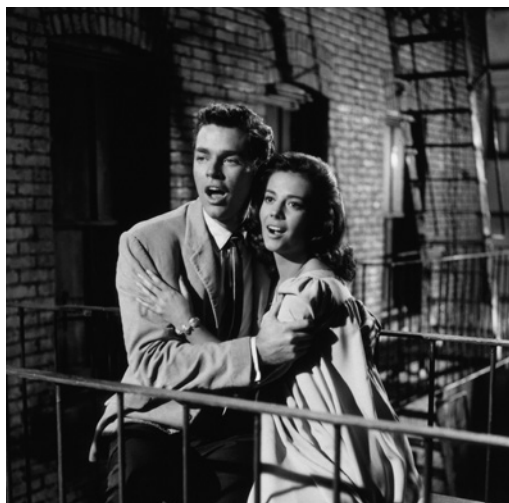
WEST SIDE STORY (1961)