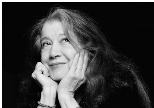
MARTHA ARGERICH