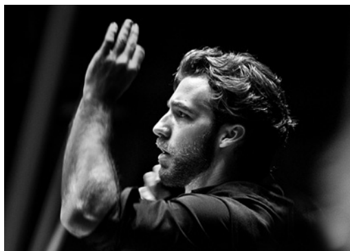
LORENZO VIOTTI