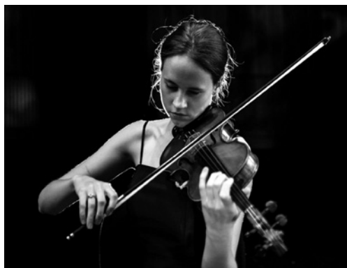
ANNA PALIWODA © GULBENKIAN MÚSICA / FEDRO PINA