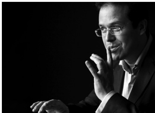
LEONARDO GARCÍA ALARCÓN