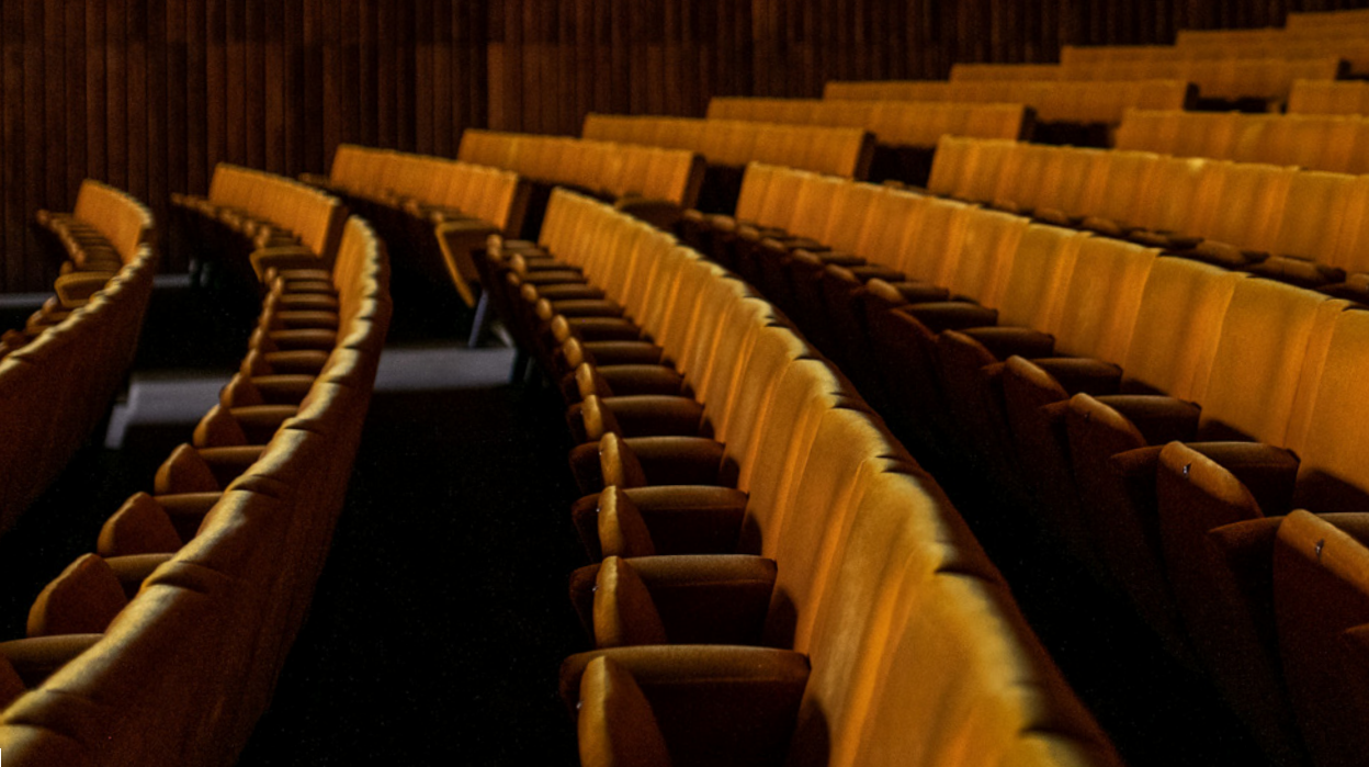
GRANDE AUDITÓRIO

Esta temporada poderá ter lugar num contexto diferente do das temporadas anteriores, mas o que permanecerá igual é a convicção dos nossos artistas, bem como a sua firme vontade de dar ao público os melhores espectáculos.