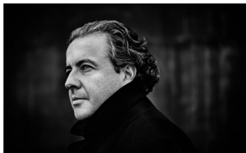
JUANJO MENA