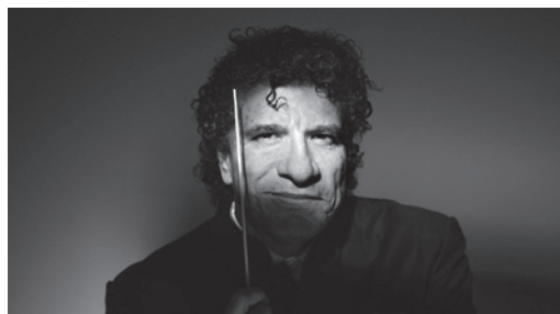
GIANCARLO GUERRERO