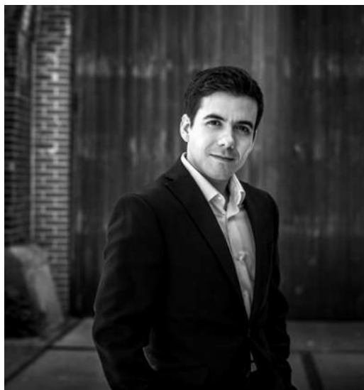
NUNO COELHO