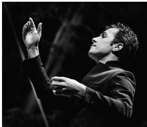
DIOGO COSTA