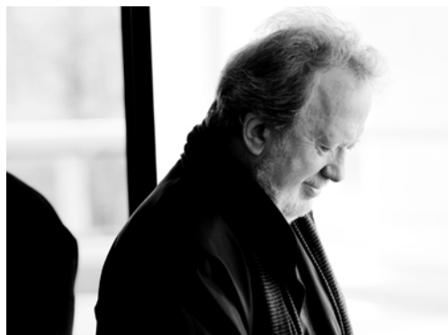
JOHN NELSON © DR