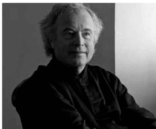
ANDRÁS SCHIFF