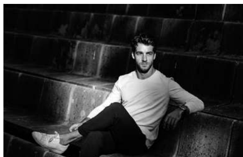
LORENZO VIOTTI